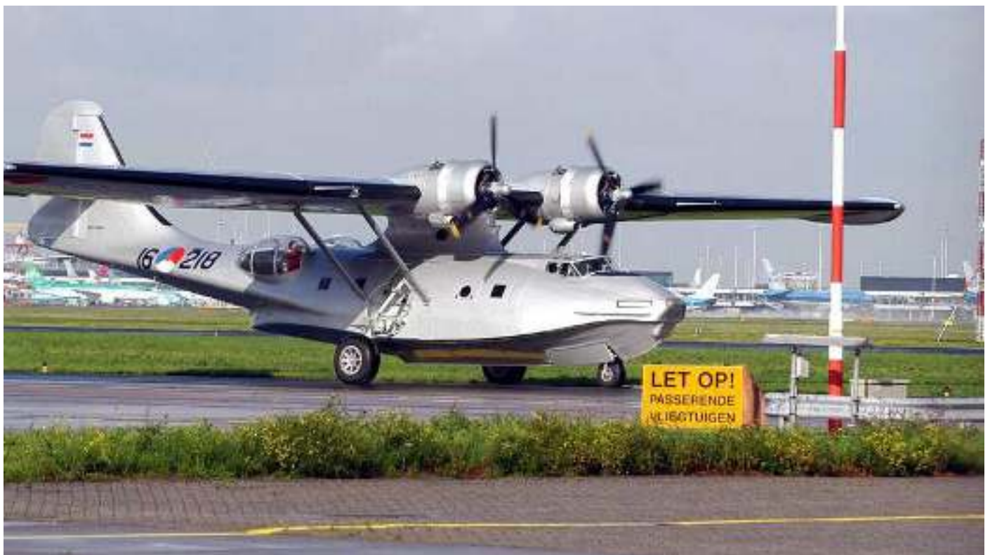
Helaas is deze Catalina Vliegboot op 5 mei 2019 voor het laatst over Nederland gevlogen

Het toestel wordt opgenomen in de collectie van het vliegend museum van de Collings Foundation in Boston.