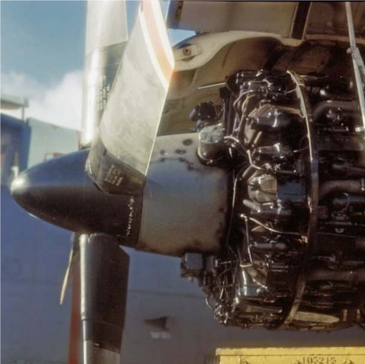
Motor en propeller van een Lockheed P2V-7B, P-2H & SP-2H Neptune maritiem patrouillevliegtuig (1961-1982).

In de tweede hal stond o.a. een R 3350 Vliegtuigmotor van de Lockheed Neptune .