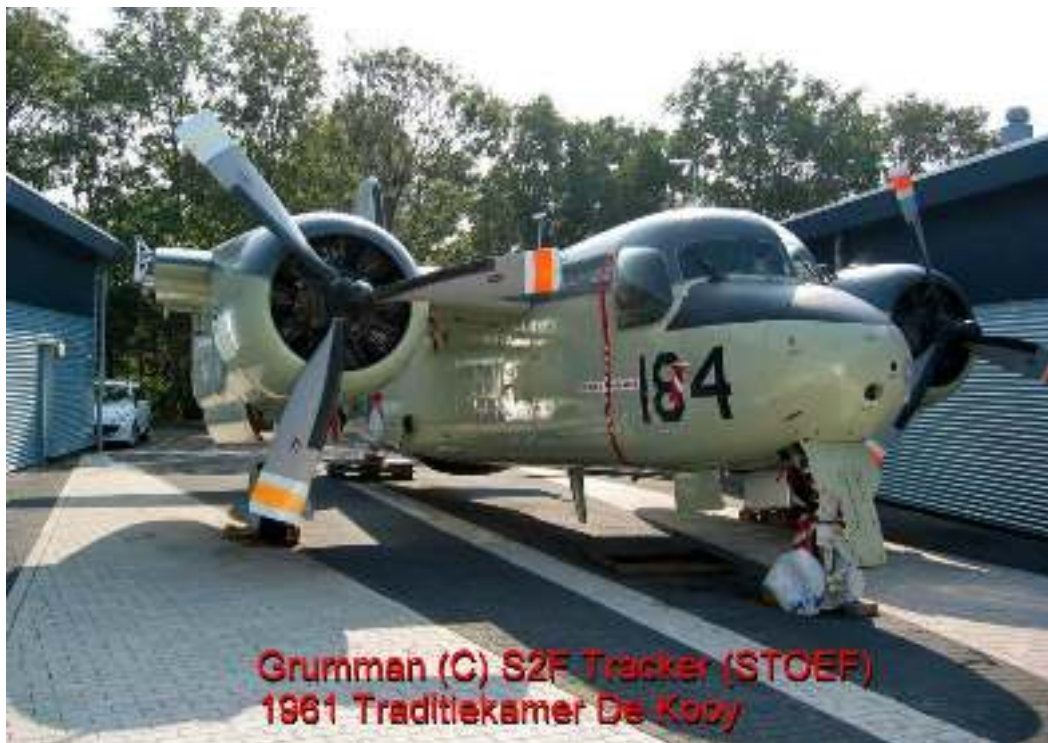
Grumman (C) S2F Tracker (STOEF) 1961 Traditiekamer De Kooy

Niet over het hoofd te zien is de Poortwachter, een imposante Neptune 216