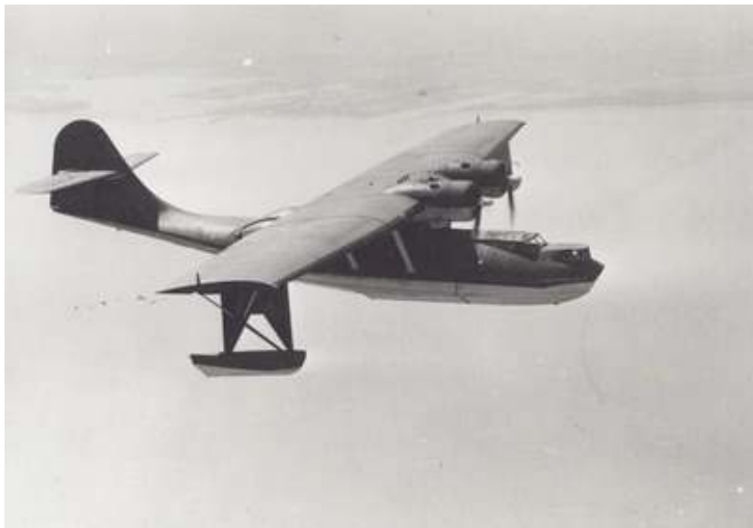
Consolidated PBY-5A Catalina