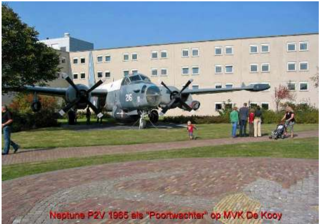
Neptune P2V 1965 als "Poortwachter" op MVK De Kooy

Niet over het hoofd te zien is de Poortwachter, een imposante Neptune 216