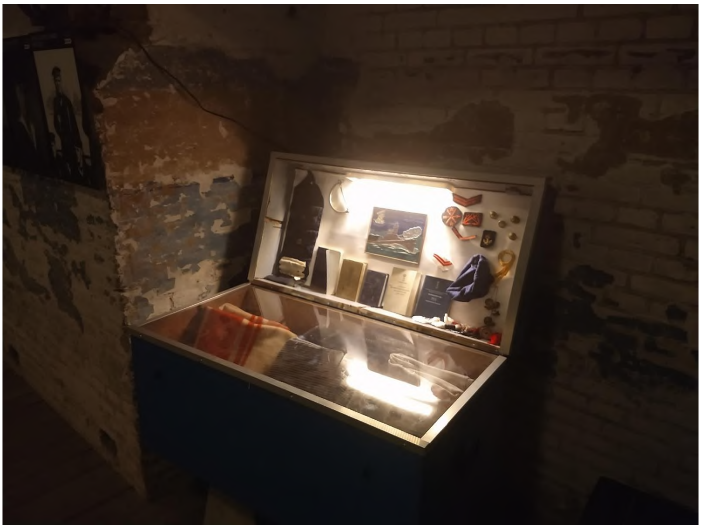
Een repat-kist met schenking